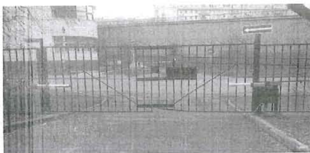
Рис. 2. Внешний вид ворот №1.

Уполномоченный представитель Резни А. Я.