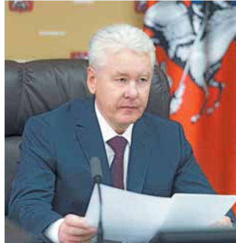
Мэр Москвы С. Собянин

Честность и прозрачность предстоящих выборов в Мосгордуму — одна из ключевых задач, которую поставил перед Избиркомом Мэр Москвы Сергей Собянин. Он еще раз напомнил об этом на заседании президиума Правительства Москвы.