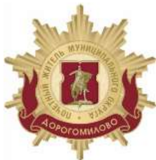
Рисунок нагрудного знака к званию «Почетный житель внутригородского муниципального образования – муниципального округа Дорогомилово в городе Москве»

Приложение 3 к решению Совета депутатов внутригородского муниципального образования – муниципального округа Дорогомилово в городе Москве от _____ 20__ года № _____